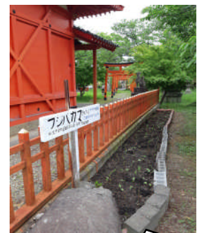
島崎稻荷神社の花壇です

5月9日(土)9時より旧青井小、島崎稻荷神社などでフジバカマの植栽が行われました。今年度は中学生の参加はできませんでしたが、支援員の皆様のおかげで、たくさんの苗が植えられました。人手の少ない中、畑づくり、植栽を大変お世話になりました。秋にはたくさんのアサギマダラの蝶が飛来してくるのを皆で楽しみにしたいと思います。