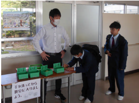
毎朝、生徒昇降口で健康チェックをしています。

なお、これまでの休校にともない、今年度の予定が今後大幅に変更する可能性がありますので、ご了承ください。